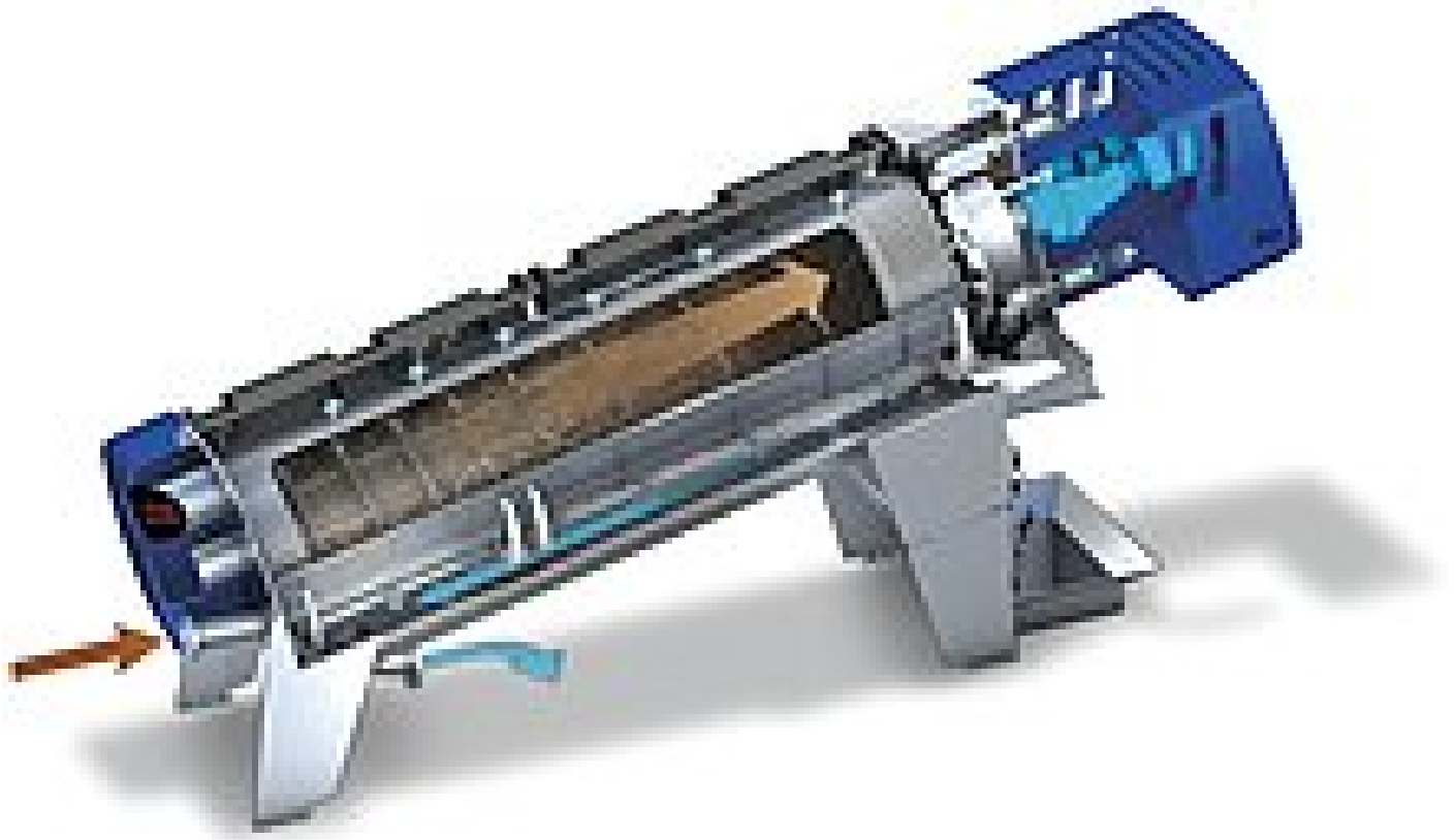
Coupe partielle d'une presse à vis sans fin Q-PRESS® de HUBER

La nouvelle presse à vis Q-PRESS® de HUBER a été présentée lors du salon IFAT 2016. Les premières machines de cette gamme sont en service depuis plus d'un an. Il est temps maintenant de comparer les expériences acquises avec les objectifs de développement.