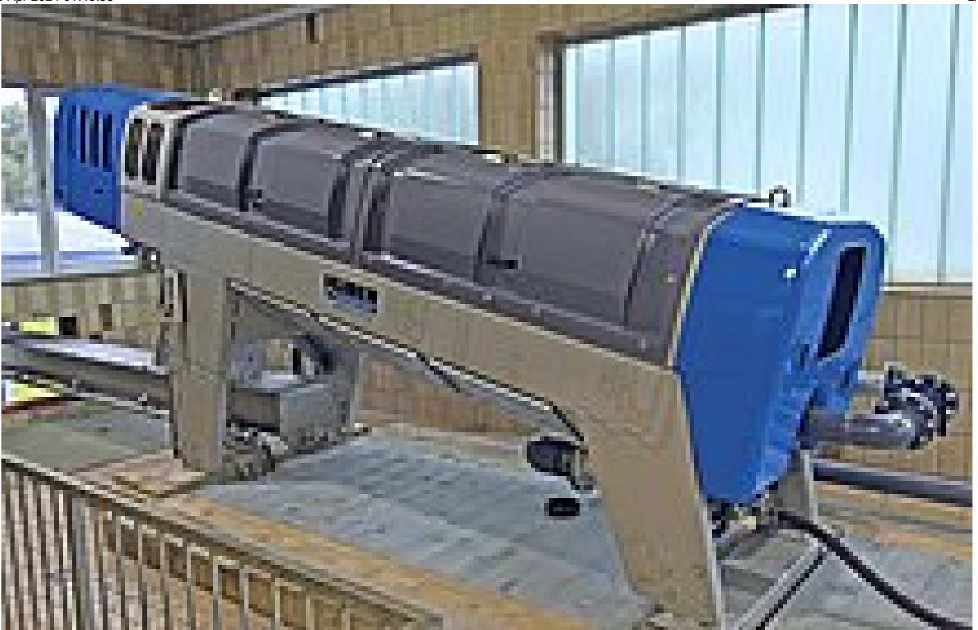
Installation fixe d'une presse à vis sans fin Q-PRESS® 620.2 de HUBER