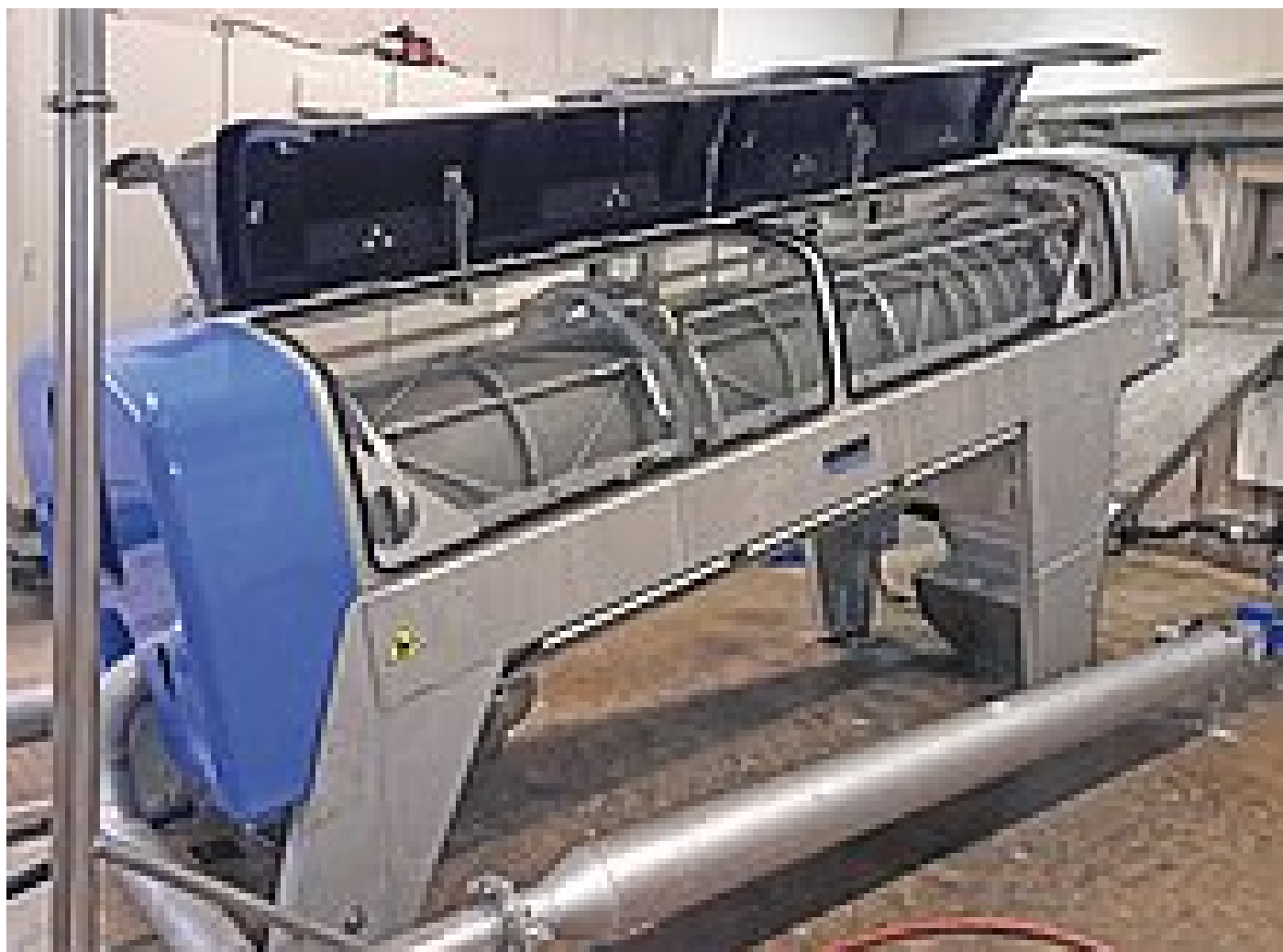
Presse à vis sans fin Q-PRESS® 620.2 de HUBER avec capot ouvert

Expériences opérationnelles avec la presse à vis Q-PRESS® 620.2 de HUBER