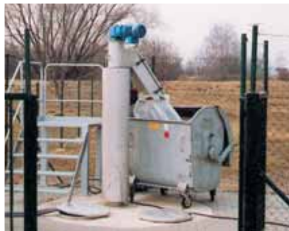
Dans sa version calorifugée, l'unité de tamisage s'installe sans complication en extérieur